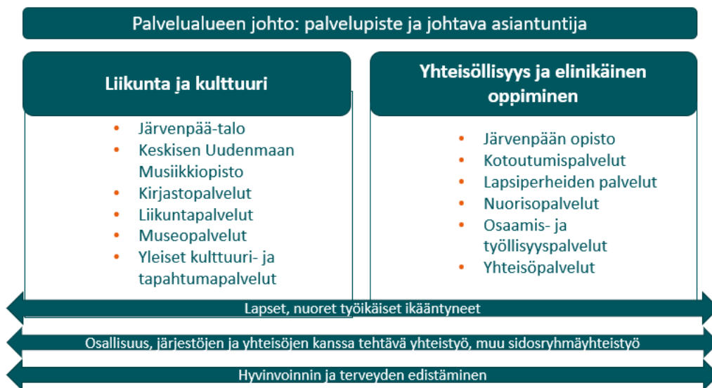
Kuva 1: Hyvinvoinnin palvelualue ja sen avainalueet

Tässä raportissa kuvataan avainalueiden palveluiden tarkoitus ja tavoitteet, nykyinen palveluverkko, sen riittävyys ja toimintaympäristön muutokset. Lisäksi arvioidaan lyhyesti keskeiset muutostarpeet ja aikataulu. Raportti toimii hyvinvoinnin palvelualueen palveluverkkoselvityksen taustamateriaalina.